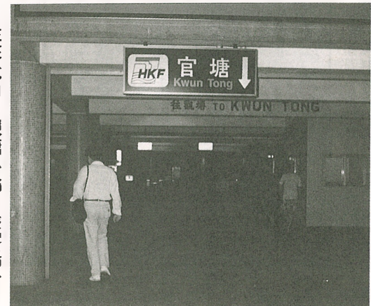
往來北角、觀塘小輪，乘客稀少。

但他又認為市民選擇渡輪小輪是因費用便宜和欣賞到海上風景，不像搭地鐵那麼擠迫。不過，若在距離碼頭太遠居住或工作的人，則多使用地鐵或海底隧道。