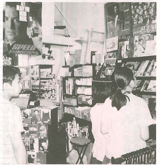
● 很多青年人都肯花大錢買自己喜愛的電影精品。

（本報訊）香港藝術中心將於九月至十一月舉辦「今天舞台系列」（Festival Now），就是一個以表現香港「此時此地」的戲劇、音樂和舞蹈的表演藝術節。 藝術中心總監如國烈說，這系列主要是想用些當代、「此時此地」的元素，做些切合香港時代的表演藝術。 「今天舞台系列」包括了九月的「短劇戲流」，十月的「音樂實驗室」和十一月的「新浪潮舞蹈節」。 「短劇戲流」將於九月率先登場，由八個參與演出的戲劇團體，經過十個月的討論交流，並圍繞「我們的香港故事」這題目進行創作，然後在劇場裏作不同的演出。 如國烈表示，邀請八個不同風格的團體，有年青新進的、前衛的、發展成熟的劇團，也有業餘劇團、小型專業劇團、職業劇團等，是希望多方面地呈現香港的戲劇景象；而在「此時此地」這廣闊概念下，不同的團體也可以作不同類型的嘗試。 而隨後十月登場的「音樂實驗室」，如國烈透露，會是「此時」的非商業性和實驗性的音樂表演。 至於最後的「新浪潮舞蹈節」，會是七位香港新編舞家對「此時」題材的創作演出。 「今天舞台系列」會於九月起假藝術中心舉行，演出門票於城市電腦售票網有售，有關節目查詢，可致電藝術中心（25820203或25820292）。