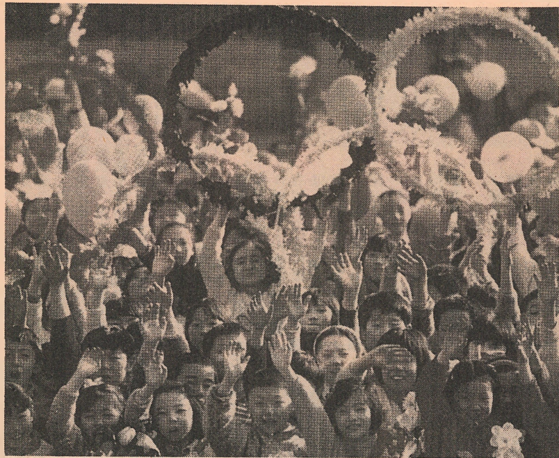
奧運主辦權，將於九月廿三日揭盅。

今年初，李登輝與郝柏村對新任行政院長人選無法達成共識，其後二人分別提名連戰與林洋港爭任行政院長。李登輝為了保護連戰順利過關，便拉攏民進黨支持連戰，結果他順利成為新任行政院長。有稱國民黨這樣做是怕新連線，或稱黨內「非主流派」勢力助力，甚至連戰組內閣也是「一言堂」，「非主流派」沒取一席，江泰惠對此並不認同，她表示無論是新國民黨也好，舊國民黨也好，也都是國民黨。相反地，新國民黨可作平衡作用。雖然新連線有一定實力與影響力，這只會促成國民黨內民主，建立一個更民主的黨派。