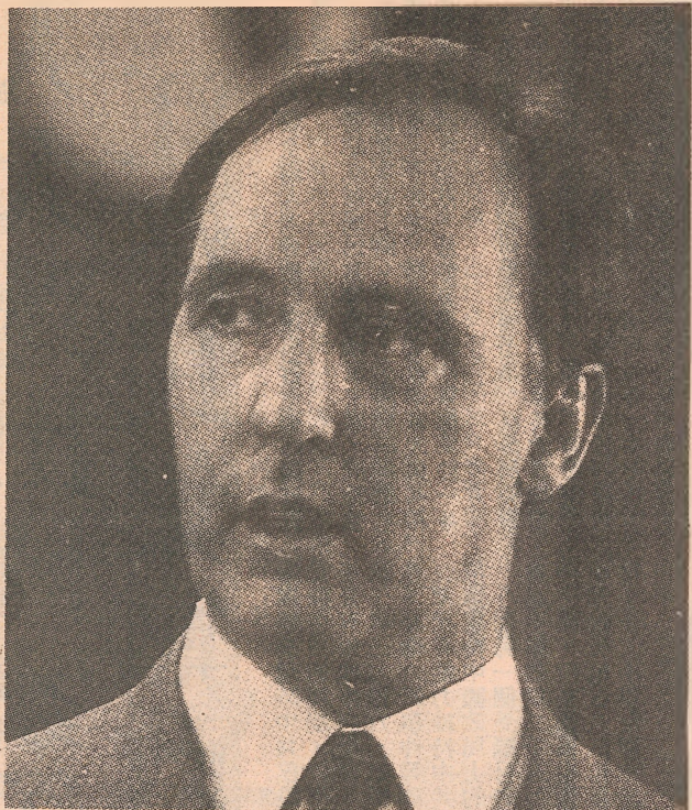
基廷在經濟衰退下，仍帶領工黨贏得大選。