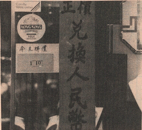
除了銀行，金行也可兌換人民幣。