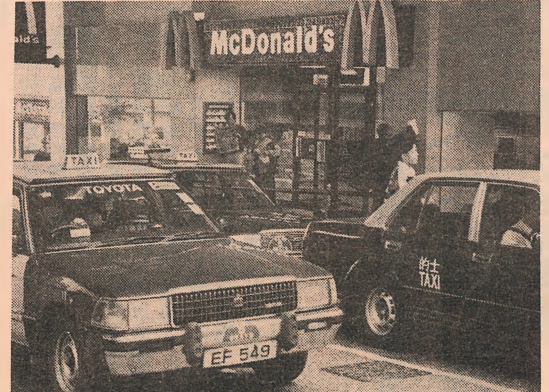
價加請申士的港香

（本報訊）縱使東頭邨部份居民堅決反對在區內興建智人宿舍，但政府不會取消原來的興建計劃，更會在未來五年為超過一千名嚴重智人土建二十二間宿舍。 社會福利署助理署長（青年及康復）陳偉君指出，現時約有一千八百名嚴重智人土等入住社署所提供的宿舍。而政府計劃在未來五年內可容納一千一百五十個宿位，以平均每週五十二人計算，即約需多建二十二間嚴重智人土宿舍。由於需求很大，所以不會取消在東頭邨內興建智人土宿舍的計劃。