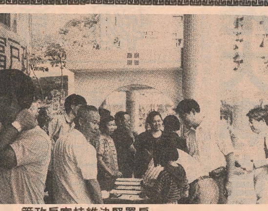
策政戶富持維決署房

（本報訊）縱使東頭邨部份居民堅決反對在區內興建智人宿舍，但政府不會取消原來的興建計劃，更會在未來五年為超過一千名嚴重智人土建二十二間宿舍。 社會福利署助理署長（青年及康復）陳偉君指出，現時約有一千八百名嚴重智人土等入住社署所提供的宿舍。而政府計劃在未來五年內可容納一千一百五十個宿位，以平均每週五十二人計算，即約需多建二十二間嚴重智人土宿舍。由於需求很大，所以不會取消在東頭邨內興建智人土宿舍的計劃。