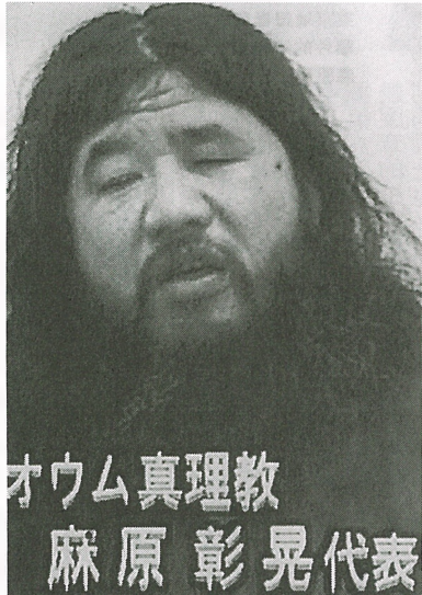
才ウム真理教 麻原彰晃代表

(五月十五、十六日)東京地鐵毒氣事件發生八個星期後，日本警方在兩日內，拘捕涉嫌謀殺事件的奧姆真理教領袖麻原彰晃與要員井上嘉浩。但日本市民未見得就此鬆鬆，因為在拘捕行動後不久，東京市市長辦公室遭郵包炸彈襲擊。