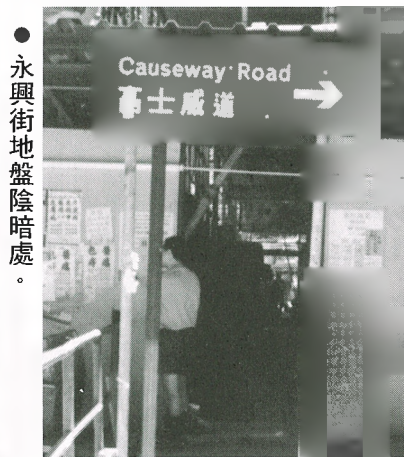
永興街地盤陰暗處。

（本報訊）地盤工程築起圍板造成長達十多米的陰暗通道，引來「癮君子」躲藏在不當眼處「打白粉針」。鄰近居民投訴影響環境衛生。 該地盤位於天后永興街六號一座八層高的大廈，正在準備進行清拆工程。除外牆架起棚架外，大廈地舖前行人路也築起圍板，及加建上蓋造成一個長達十多米的陰暗通道，讓行人穿梭往來。 這樣，地盤造成的不當眼地方，令吸毒者經常躲藏在該處「打白粉針」，遺下針筒影響環境衛生。 據悉：四月時鄰近居民投訴該處影響環境衛生及滋擾市民，但至今整座大廈的居民已全數遷出，只剩下途人熙來攘往。地下街舖已進行拆卸，但在垃圾堆與瓦礫中仍可尋針筒的痕迹。記者問途人可曾留意有吸毒者？他們說因白天途人熙來攘往，吸毒者沒有那樣明目張膽，故只見針筒掉在路邊。 鄰近居民希望政府當局能注意此問題，及通知警方加派人手巡視該處，以起阻嚇作用。