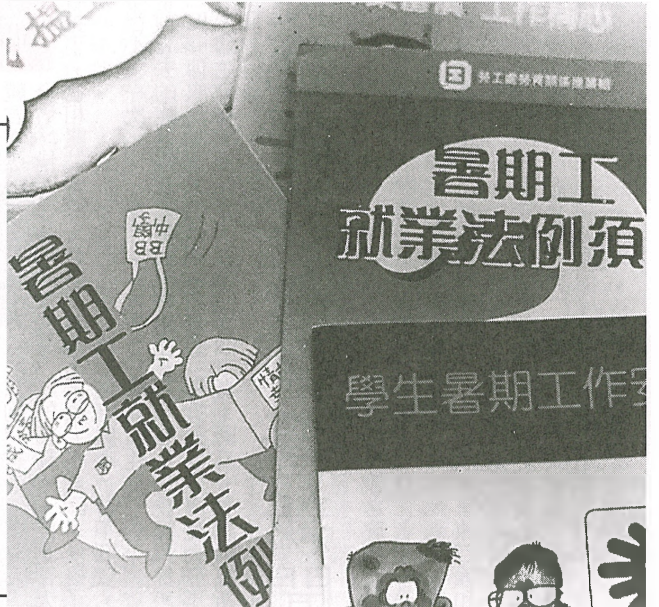
●學生可以從勞工處索取有關暑期工的資料。

（本報訊）暑假將至，莘莘學子都為了找尋暑期工，而四出奔走，但往往到處碰壁，遍尋不獲好工作，或可能被騙徒乘此空隙，敲詐學生金錢。故此，學生在找暑期工作時，便需格外留神。 學生們經常會到處找尋工作，但卻苦無結果，究竟暑期工作是否真的如此難尋呢？ 其實在香港，很多機構均會聘請學生當暑期工的，例如飲食業有傳單等，甚至政府亦有招請學生作短期工作，當然，勞工處是尋找暑期工作最安全的地點。 每年政府都有一些短期的職位空缺，以供同學們申報，勞工處亦會就個別同學的需要而提供協助。另外，該處亦向學生解釋相關法例及如何保障自身利益的條文。 每年暑假，一批「學生哥」都會在勞工市場出現，而他們更造成不少僱主的煩惱，因為這批學生多沒有實際工作經驗，而且往往只工作一、兩個月便辭職、繼續學業；試問，僱主又怎會願意聘請那批「做唔長」的學生呢？ 大部份中五及中七的學生都認為暑假是他們「搵銀」的黃金時間，預期每天都呆在家中百無聊賴，倒不如利用這段時間賺取些少金錢。 當然亦有一些是因經濟方面出現困難而需要找尋工作，但這些畢業生在找尋工作時往往遇上很多困難。例如當僱主知道他們做暑期工時，多不願意聘請，甚至有部份僱主，多不願意聘請，甚至有部份僱主，以利誘無知的青年上當，以取其金錢。 現試就以上三方面——勞工處、學生尋找暑期工所面對的各種問題。