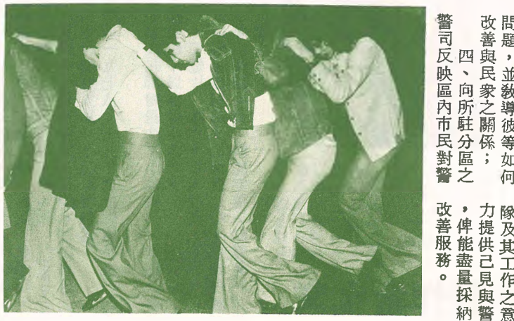
玩麻鹿捉小雞？這是不！這是一幕能發生罪案的時制制止了。

如何請求警方協助 請警關係主任工作 你會請求警民關係主任協助嗎？ 假如沒有的話，可以告訴你：警民關係主任歡迎閣下在辦公時間內親自到警署或撥電約見。 現在每一警局分局都設有警民關係主任，只有沙田和水警分局未設有。警察公共關係科發言人表示：為全面發展警民關係，會盡速在這兩區設置警民關係主任。 警民關係主任是警方與市民間的橋樑，其 主要任務及工作有下列四點： 一、與區內各社會團體，包括民政區區委員會、地區委員會、互助委員會、街坊會、學校及其他社團組織等建立良好之關係，並經常與之保持密切聯絡； 二、向市民介紹警隊之工作，建立市民對警隊之信心及改善市民對警務人員之印象，並盡力提供意見，隨時隨地指導及協助市民； 三、向隊中員屬講解各種有關民衆關係之