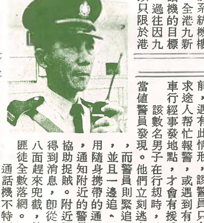
功奇建機話通 網落幫匪

九龍通訊機現已啓用 警員配帶的新裝備——通訊機，嚴重打擊罪案。警察公共關係科發言人表示，並強調九龍區通訊系統投入工作後，整體效能將更超卓。 發言人說：九龍區通訊系統機樓五月底會完成，屆時，全港九新界每位警員都配備通訊機的目標，便可達到。他表示，過往因九龍區機樓未竣工，所以只限於港島及新界區的警員有此配備，九龍方面暫時未有。 隨身配帶的無綫電話機，在去年底港島及今年三月新界區使用至今，短短期間內因利用通話機捕獲罪犯或救人的案件，為數不下百宗。 發言人稱：此類通話機，結構普通對講機複雜，不單通話機間可互相對話，亦可與總部聯絡，收聽總部的指示，而且此類通話機性能特佳，就是在屋內也可以應用，不會因電波而受阻，不能通話，這是其他對講機不能辦到的。 他表示為撲滅罪惡，警方不惜投下巨資三千萬，雖然款項巨大，但所得效果遠超過此數目。