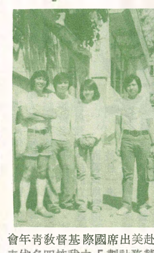
赴美出席國際基督教青年會代表名四校我之「劃計務營」