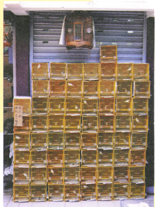
鳥籠一排一排的疊起，方便途人選購