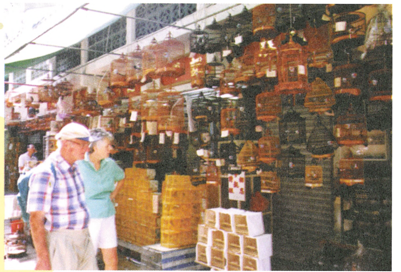
外國旅客都愛到雀仔街一遊