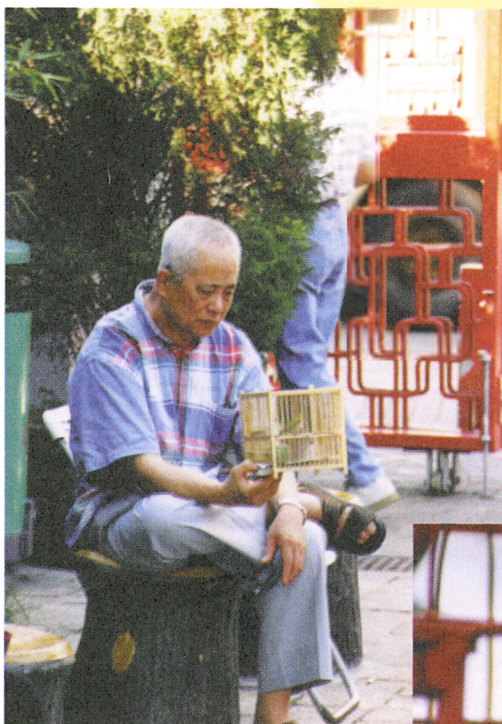
一鳥在手，老人可樂上半天

雀仔街是愛好玩雀及外國遊客必到之地。小小街道盡是販賣雀仔、雀籠和飼料的小商人，玩雀之人和商販之間瀰漫著一種後街文化。