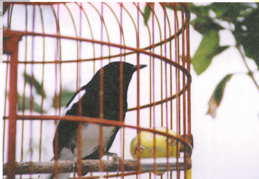
雀鳥的售價取決於其歌唱能力