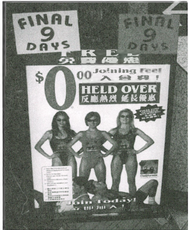
健身中心爭相以減價作招徠

身中心亦開始愈來愈見品流複雜。有時有些使用率高的設施，經常出現輪候的情況，使健身室擠滿很多人，而有些健身的地方更是男女共用，原是一個消閒減壓的地方，很容易就變成像的士高或市集般嘈雜，並有時會出現會員為了使用設施而發生爭執。 香港人往往會有「怕蝕底」的心態，既然已是會員，交了會費，應該要嘗試所有設施，但他們有時會忽略設施是否適合自己，而健身中心又很少會加以提醒，市民因此很容易會弄傷自己。例如：有些設施其實並不適合用於某類人仕，好似有心臟病者不宜使用桑拿設施，體型過瘦者不需要減肥療程等，選用健身機械的磅數不合當。 要有健美的身軀，並非一朝一夕的事，除了要配合一所好的健身中心外，亦要視乎消費者的恆心和毅力！