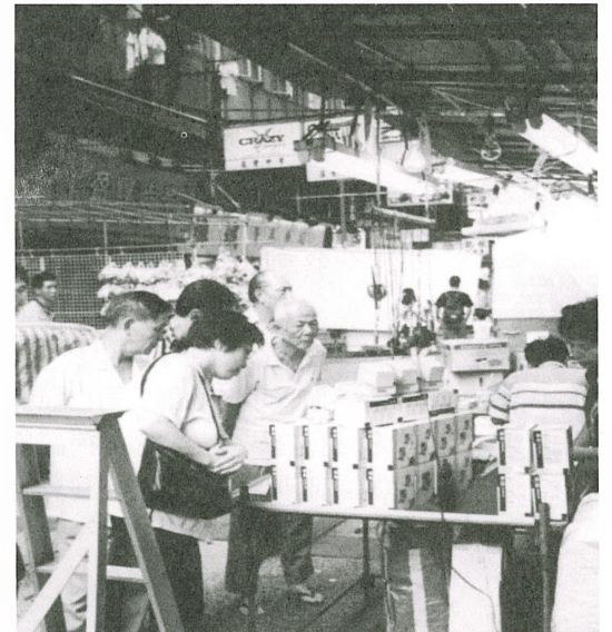
廟街延長營業時間後，預料會吸引不少遊客

的士站，改為旅遊巴士上落客站，以方便遊客。除廟街外，旅協亦正與赤柱大街的商戶研究，將市集的關門時間由晚上六時延遲至晚上八時，希望吸引夜市遊客及市民。 一名成衣攤檔老闆表示，「延長營業時間多少可以增加生意，『幫補』在市道差時的收入」；一名遊客亦表示延長營業時間，可給他們有更多時間選購平價貨品。 居於廟街樓上的住客則表示，新的營業時間增加了嘈音，不過情況尚可接受；但部份廟街店舖的東主，就認為計劃可能會影響到他們的生意，因為攤檔提早擺賣會搶去他們日間的顧客。