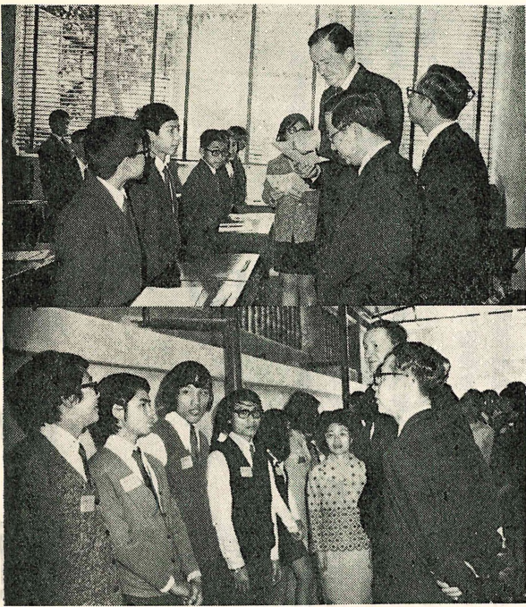
上圖：港督蒞臨訪問 下圖：督憲與專大代表交談

牆、掃地、升旗、插花、佈置椅檯、巧製食品……跑上跑下，好不熱鬧。十一時四十五分，督憲座駕車抵達堅尼地，由校監和校長陪同，對本校弘揚學術，發揚