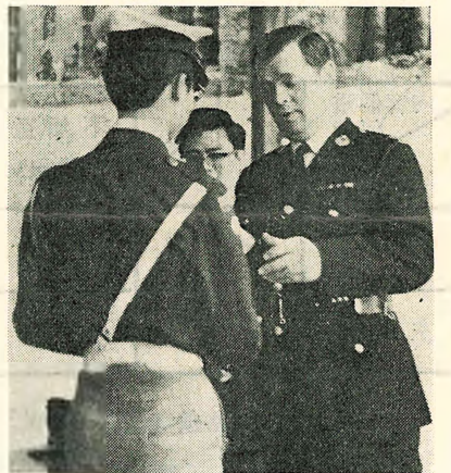
鮑華警司授憑時攝

為促進道路安全，確保學生遵守交通規則起見，本校特組成一支陣容強大，擁有廿四名熱心服務的隊員之交通安全隊，於一九七四年二月初舉行正式成立典禮，由灣仔區警司鮑華蒞校致訓，檢閱後，即頒發委任文憑。校監胡