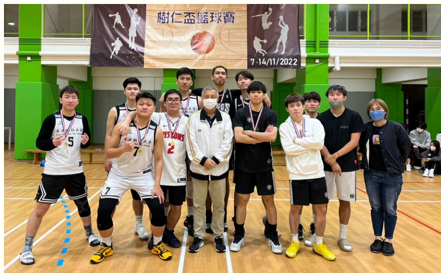
男子得獎隊伍合照。