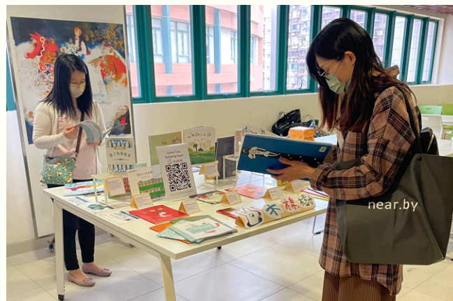
Mini- Exhibition of Cotton Tree Publishing.

used in educational materials. The dynamics of the poster presentation enabled students to explain themselves well, and guests were impressed by the wide range of children's literature investigated.