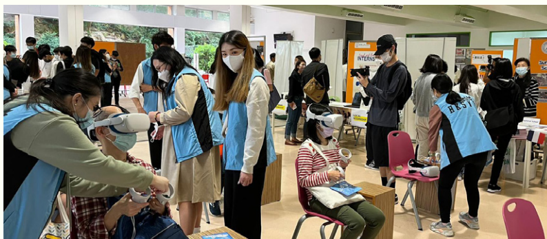
「元宇宙教學體驗館」。