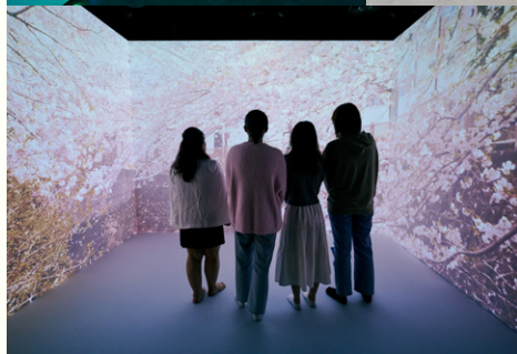
VR Lab以光與影給來賓的感官帶來新體驗，同場亦展示科技帶來的智慧城市。