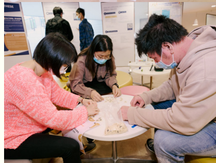
英國語言文學系連同語言中心(英文部)舉辦小型展覽，並提供課程諮詢、來賓透過學系的小遊戲擴闊語言的領域。