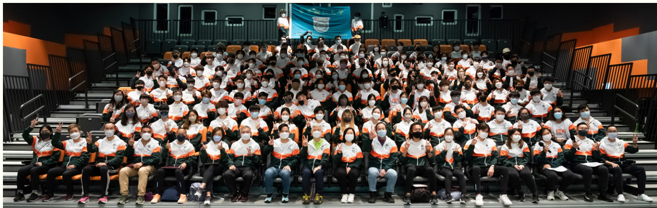
體育部第二年舉行運動代表隊宣誓典禮。

體育部於2022年10月21日舉行「運動校隊宣誓典禮」。出席典禮者除了16隊校隊成員外，還有常務副校監胡懷中博士、行政副校長張少強教授、協理學術副校長(教學發展)黃君良博士、協理副校長(學生事務)葉秀燕女士、體育部主管龔曉恩博士，與領取長期服務獎的教練及上年度三位精英運動員。全體師生和大學管理層都穿上校隊風褸出席，典禮一開始便播出介紹16隊校隊的短片。