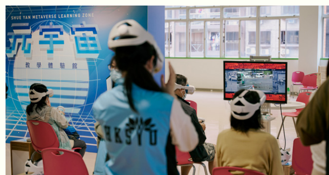
「元宇宙教學體驗館」為參觀者提供不同的VR互動體驗。

後者之「擴增實境遊戲區」則展示兩項由教與學發展辦公室開發的中藥AR遊戲咭及模擬精神疾病患者視像的心理學AR應用程式。中藥遊戲咭可讓玩家簡易了解中藥藥性及如何使用以舒緩或治療不同病症，而心理學AR程式則把幻覺及幻聽等精神疾病患者所感受的視覺和聽覺具體呈現出來，加強學習輔導與心理學的學生對這些疾病的認知。招生事務處也設計了學系AR遊戲咭，來賓親臨資訊日時會獲派本科生招生指南，內裡有一份共12張、代表仁大12個學系的學系咭。只要使用指定AR應用程式掃一