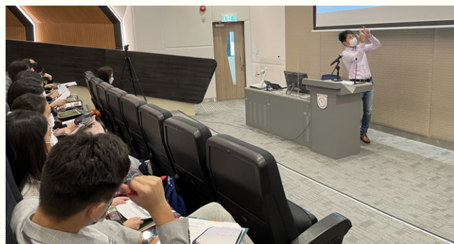
第二階段工作坊為入圍十隊參賽隊伍解說如何寫好計劃書和演說的技巧。

是次比賽之獎金、獎座及獎牌由香港樹仁大學贊助，而獎品則由香港青年工業家協會青年委員會贊助：