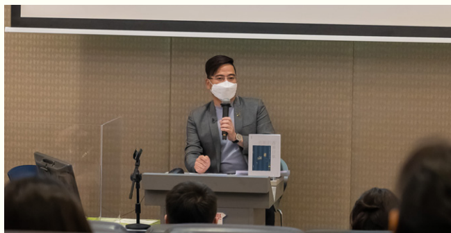
張少強教授從對興盛時期的本地粵語流行歌詞進行跨學科研究，尋繹中華文化在香港的傳承與轉變。