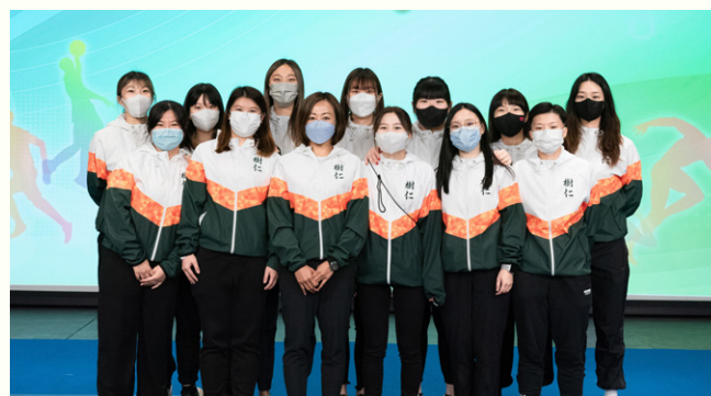
女子排球隊將積極參加各種友誼賽讓隊員實戰操練。