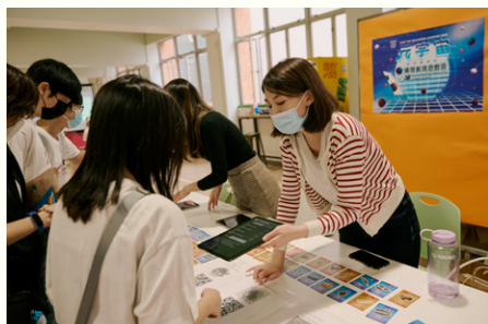
教與學發展辦公室為學生講解中藥AR遊戲咭及模擬精神疾病患者視像的心理學AR應用程式。