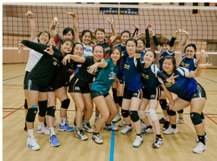
資訊日當日樹仁學生事務處體育部邀請現役樹仁女子排球隊與歷屆女子校友排球隊比賽。