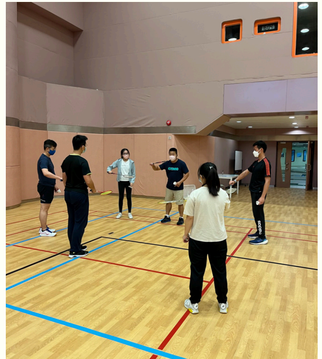
教練仔細指導參加者正確的握拍方式。