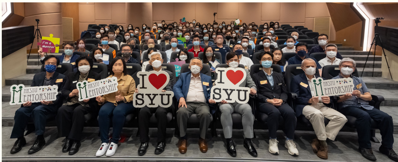
參加「良師益友計劃」的同學和校友與出席開幕禮的嘉賓合照。

香港樹仁大學學生事務處籌劃的「良師益友計劃」(Mentorship Programme) 2022/23開幕禮暨2021/22閉幕禮，在2022年11月19日於研究院綜合大樓3樓演講廳圓滿舉行。