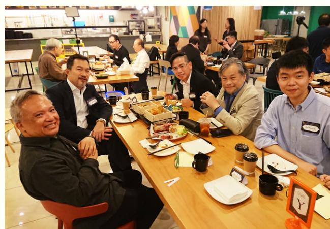
大家在美食相伴下，氣氛熾熱，交流順暢。