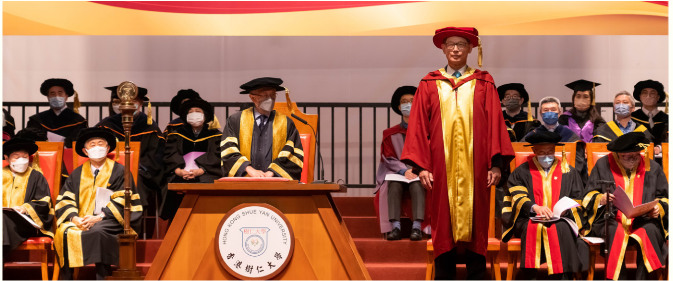
金管局前總裁陳德霖獲頒授榮譽工商管理學博士學位。

金管局前總裁陳德霖，在香港樹仁大學第48屆畢業典禮，獲頒授榮譽工商管理學博士學位，表揚他對香港金融制度的發展有巨大貢獻，並為推動博雅教育的價值不遺餘力。