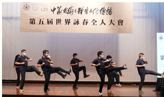
一眾詠春愛好者輪流上台獻技。