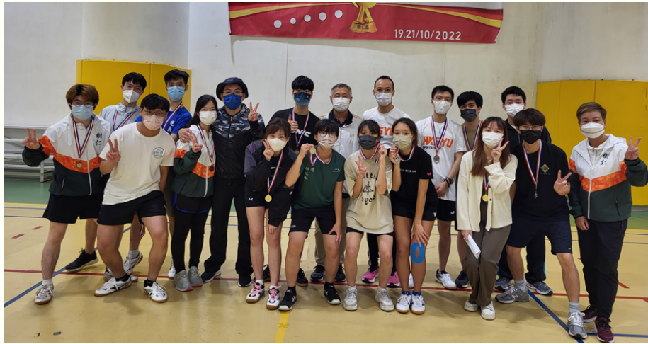
乒乓球賽後眾人拍攝大合照。