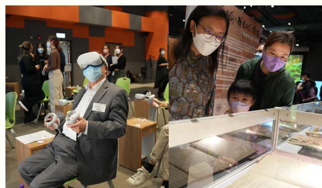
▼ 嘉賓正在觀看葉問詠春在港發展的珍貴文獻、相片、真跡及會議紀錄等第一手資料。