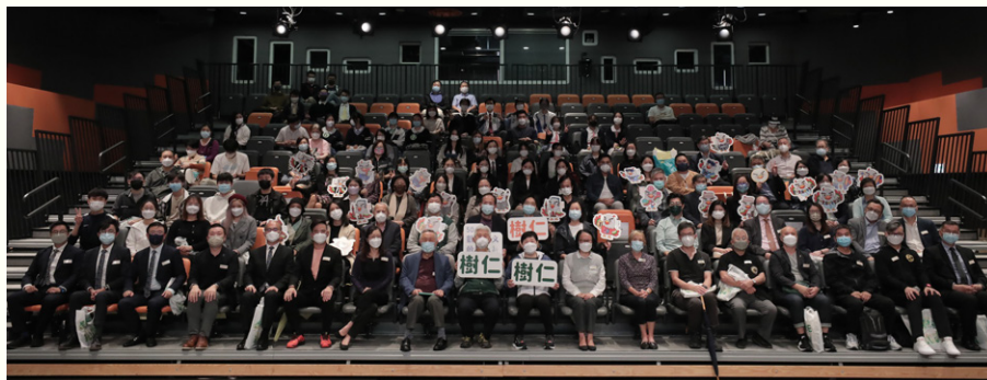
仁大資訊日開幕禮後大合照。

香港樹仁大學在2022年11月26日舉行資訊日(Info Day)，今年的主題是「50+1:數碼人文，敢於創新!」(50+1: Digital Humanities – We Innovate!)。樹仁大學的老師和學生當日總動員，讓到場參觀的公眾人士深入認識樹仁的課程、設施及最新發展，感受愉快的校園氣氛。