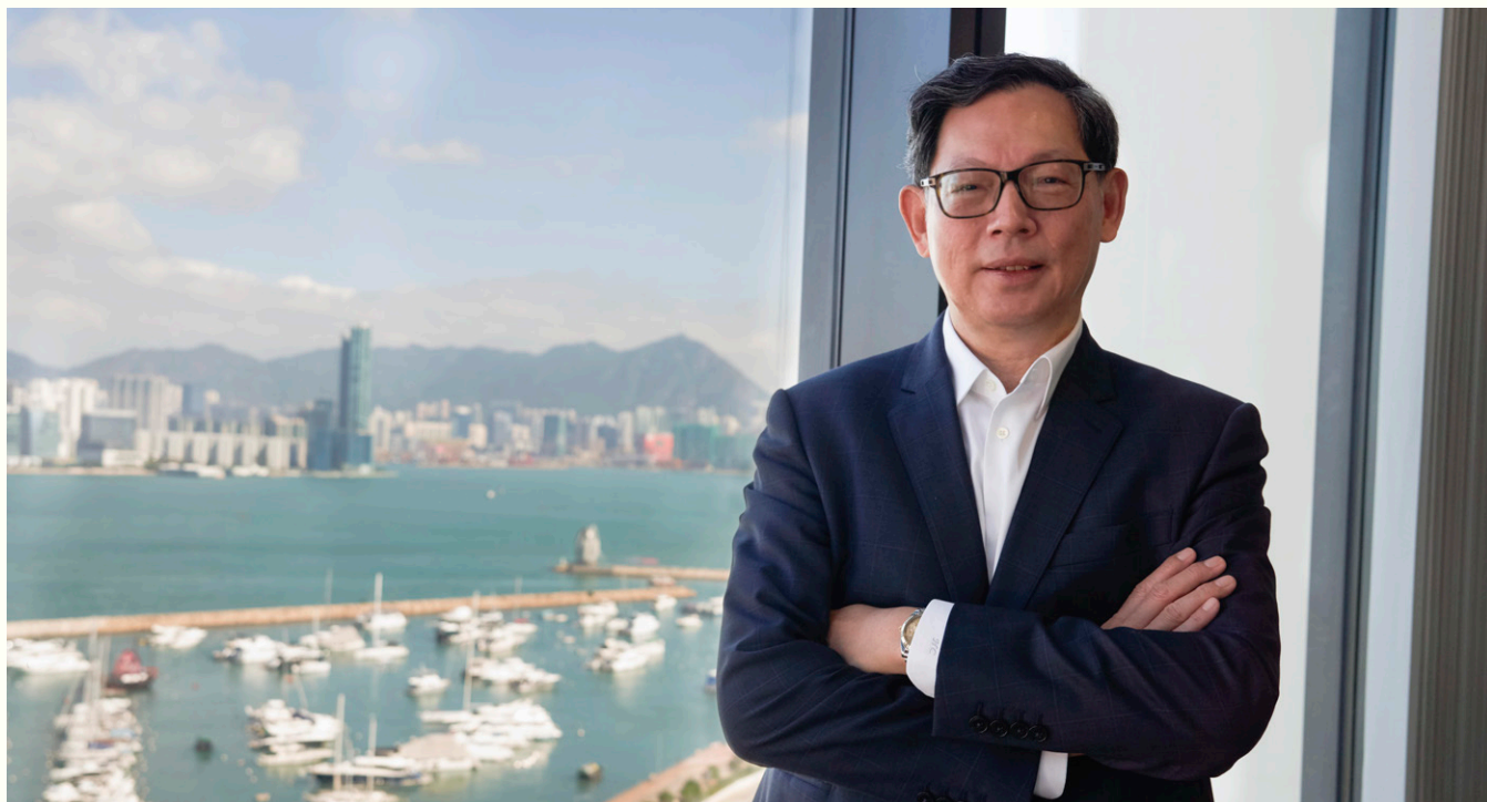
Norman Chan still keeps his appetite to learn as it helps him adapt to change.

Following a decade-long tenure to lead the de facto central bank in Hong Kong, Norman CHAN, the former Chief Executive of Hong Kong Monetary Authority, chose to embrace technology after his retirement by setting up his own fintech firm.