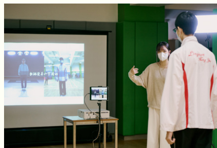
學生正透過人工智能系統學習「小念頭」。