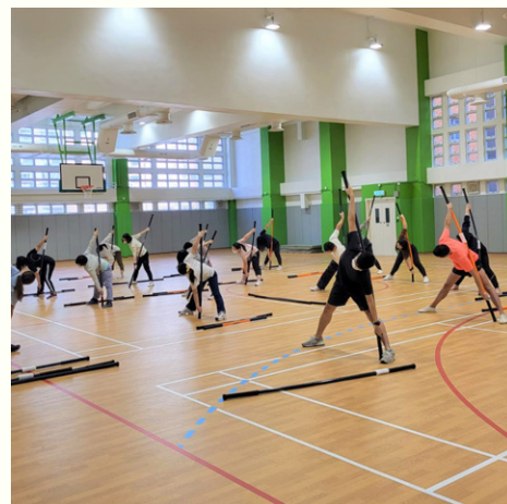
教職員們相當投入。