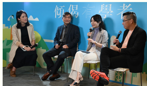
現代與當代女性創作的文學、藝術、影像作品備受關注，講解她們的創作如何影響社會與文化價值。