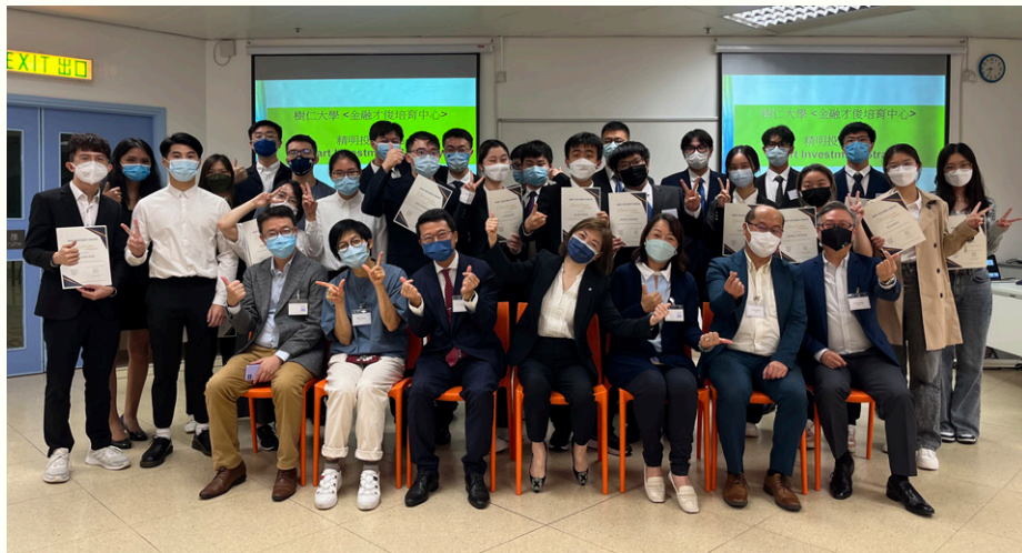
10月份「精明投資策略」工作坊學員與導師在最後一堂拍攝大合照。

仁大金融才俊培育中心和學生事務處於10月合辦了一連四堂課程的「精明投資策略」工作坊。