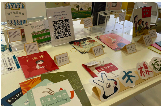
Mini- Exhibition of Cotton Tree Publishing.

and language in children's literature narratives, the interpretation of fairy tales, and children's voices in educational materials.