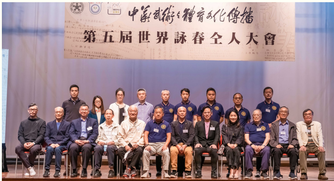
第五屆世界詠春全人大會 11月12日於樹仁大學邵 美珍堂舉行。