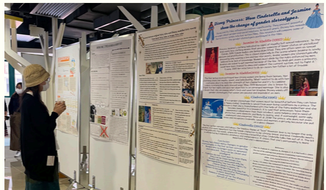
Students' Poster Presentation.