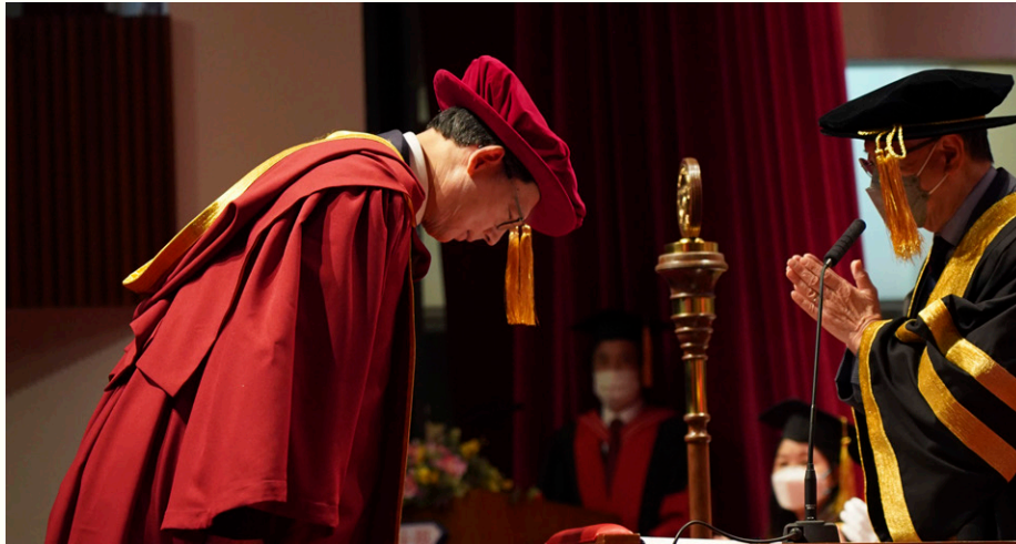
Norman Chan is honoured to receive the Degree of Doctor of Business Administration, honoris causa from Hong Kong Shue Yan University.

embedded with qualities such as self-demanding and a sense of responsibility towards the society. “One does not deserve to be called an intellectual if he or she cannot keep within the bounds of propriety or cultivate virtues of benevolence,” he said, making references to the mottos. It does not necessarily mean rolling back the clock to learn Confucian classics such as the Book of Rites, but he believed universities need to put in more efforts creating an environment favourable to students learning manners and virtues. While circumstances vary in different institutions, it shall be up to the universities to pan out the details.