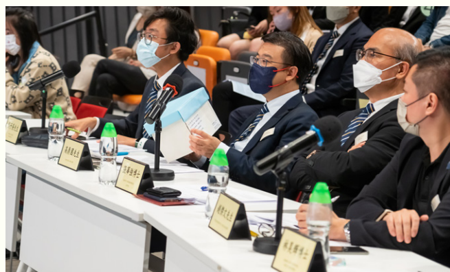
評判在問答環節向學生作出提問。