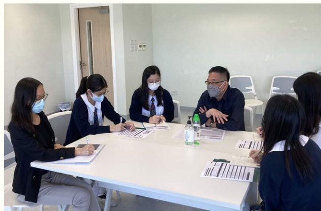
師友計劃由仁大教授或青年工業家為每隊入圍隊伍分析及建議改良方向。