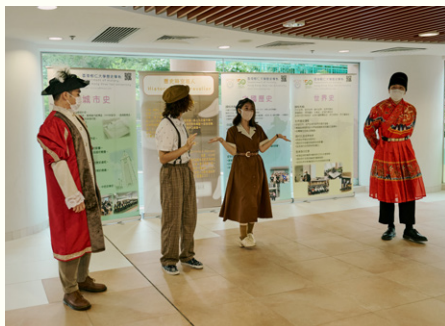
由歷史學系主辦的街頭歷史短劇表演吸引不少觀眾。