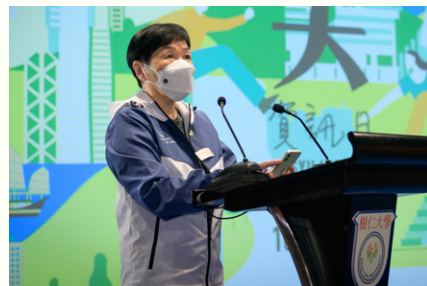
首席副校長孫天倫教授接受《樹仁簡訊》訪問時表示，仁大是一所師生間充滿仁愛、關懷的大學，勉勵學生要對未來有清晰目標，做好人生規劃，努力地朝著目標前進。

在這個重大的活動，寓意大鵬展翅的仁大吉祥物「鵬鳥」也以數碼虛擬的動畫造型和大家見面，祝願大學師生們都有更高成就。今年仁大的同學們在各方面都表現出色，所以大學特別安排了頒發嘉許狀的環節，由孫天倫教授頒發予於公開比賽中獲得佳績的學生，表揚他們為校爭光。當中包括兩位來自輔導及心理學系、於2021-22年大專院校運動比賽奪得金牌的同學；兩位來自中國語言文學系、於「第三十二屆全港詩詞創作比賽」位列三甲的同學；另於2022香港傑出大學生財務策劃師比賽奪得冠軍、現正修讀經濟及金融學系的四位同學。仁大樂見同學們在運動、創作及決策等本科學習以外的範疇都有出色表現，希望他們找到自己的專長，繼續努力和前進。至於行政副校長張少強教授及學術副校長陳蒨教授則向出席開幕典禮的嘉賓及校友致送感謝狀及紀念品，感謝他們一直支持仁大的發展。