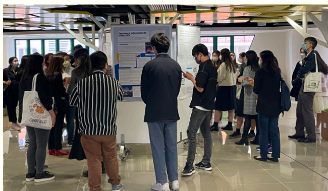
Students' Poster Presentation.

Eighteen students took part in the poster presentation. This provided a great opportunity for students to express their research visually and explain to teachers, students, and guests their views on the topics of their investigations during the poster presentation session. Topics included gender representation in Disney, and Hayao Miyazaki's animation and the use of horror in children's cartoons. Some students examined the understanding of children's literature in Chinese and English texts, while some looked into the language