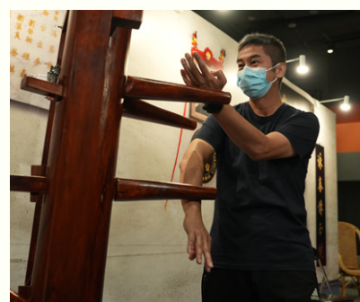
◀ 葉港超師傅透過木人樁示範招式。