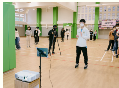
學生正透過人工智能系統學習詠春。