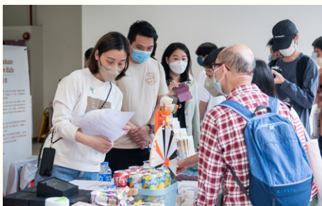
邵美珍堂三十五周年廣場擺設各學系宣傳攤位。