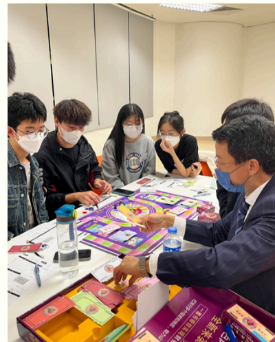
以桌上遊戲方式模擬生活情景。

仁大學生在畢業後，就會進入人生轉捩點。他們大多會選擇投身職場，在適當時候會與伴侶共諧連理、置業和生兒育女。一些學生或許會選擇繼續升學或創業。其實，每人都有不同的人生規劃，理財策略由求學到退休也會有分別。有見及此，金融才俊培育中心及學生事務處期望透過舉辦是次工作坊，讓學生為未來目標做好財務準備，建立正確的「投資」態度，而不是以「投機」和「賭博」的心態去管理自己的財務。