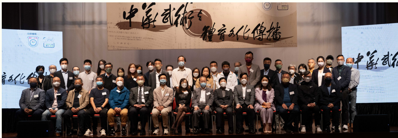
香港樹仁大學管理層及教職員、研究團隊及演講嘉賓於「中華武術與體育文化傳播」學術研討會合照，見證研究項目正式展開。

體育文化是近年社會發展的焦點之一，中華武術作為體育產業的重要組成部分，香港樹仁大學新聞與傳播學系以此為起點，開展「中華武術與體育文化傳播」學術研究項目，探討中華武術與體育文化這幾十年間在本港傳播道路上的跌盪與成果。