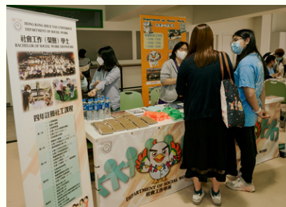
社會工作學系的宣傳攤位。