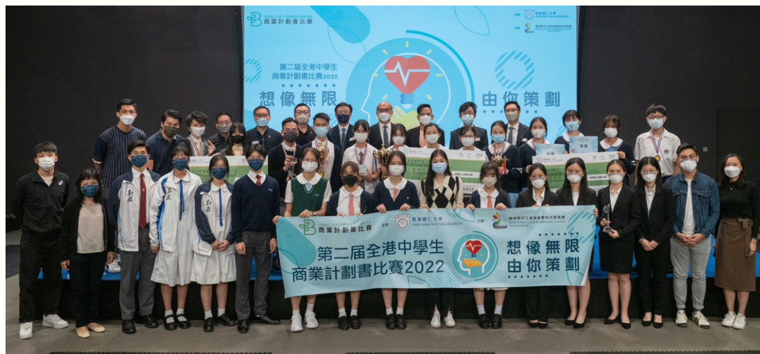
活動評判、頒獎嘉賓、帶隊老師及各隊伍成員一起拍攝大合照。

香港樹仁大學及香港青年工業家協會青年委員會聯合舉辦之「第二屆全港中學生商業計劃書比賽2022」總決賽及頒獎典禮，於11月26日在研究院綜合大樓賽馬會多媒體製作中心舉行。