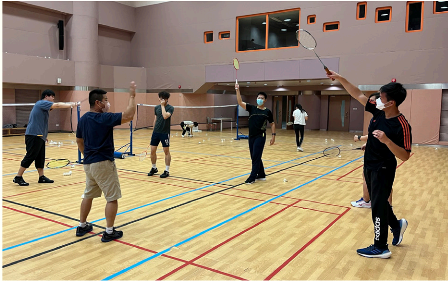
教練首課以教授基本動作為主。