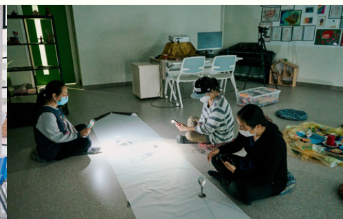
由輔導及心理學所舉辦的「動人的心理學-人寵共融的秘笈」與「表達藝術治療工作坊:探索光影變換」，帶來賓進入輔心學的不同領域，同場還有課程諮詢，分享大學學習的生活點滴。