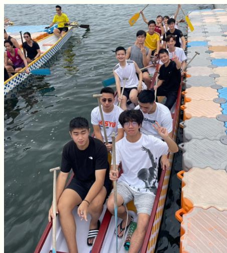
龍舟隊現正進行招募，期待有更多同學參與。