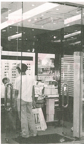
●各大眼鏡店職員的意見是否專業呢？

佩戴隱形眼鏡不是一門高深的學問，只要依照正確護理程序，加上定期找合資格的驗光師檢查眼睛，便是防止眼睛受感染和損害的良好方法。