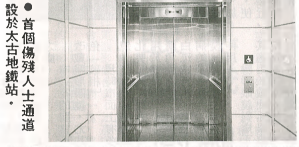
●首個傷殘人士通道設於太古地鐵站。