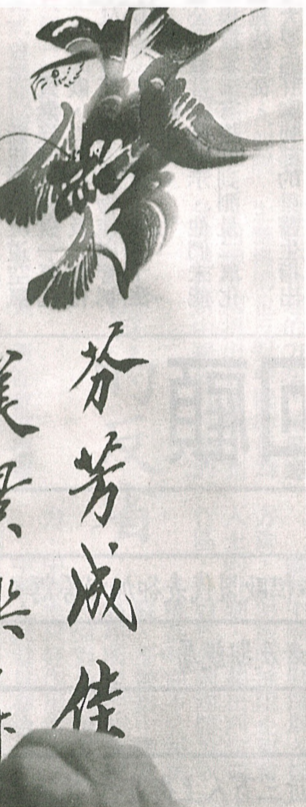
特色字畫除別具美觀外還很有收藏價值。

店員表示大部份顧客都覺得產品十分有趣及新鮮，顧客包括本地市民及遊客。如果你有興趣，不妨下一次到太平山頂遊覽時，可以參觀及選購一下，作為送禮及自用也很好。