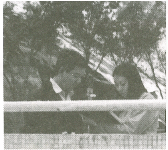
●記者於柴灣樂康區進行街訪

得出以上數字，是否多少也反映有些市民並不熟悉區議會的功能及區議員的職責；議員與市民溝