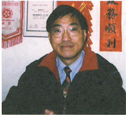
■陳達強議員認為加強與市民溝通是首要工作