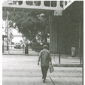
途人寧冒生命危險非法橫過馬路

港島總區交通部指出，各「交通黑點」都是人煙稠密的地方，商業住宅大廈林立。無論是車輛或行人的流量均十分高，容易造成人車爭路的情況，再加上行人及司機的疏忽，引致交通意外頻生。雖然多處交通黑點皆豎立了告示牌，警告市民不要胡亂過馬路，但很多市民卻視而不見，為貪一時之快，不待行人交通燈號轉為綠色，便亂過馬路。另外，交通黑點附近，雖有行人天橋，但市民大不選用天橋過馬路，寧願橫過馬路。