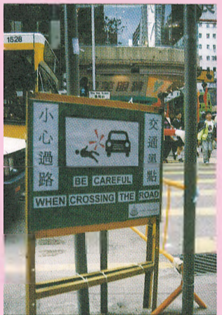
東區交通黑點多 第二版

道歉啓示 由於人為疏忽關係，本報一月號東區議會版刊載最新一屆東區區議會當選議員名單有錯漏，本報特此向東區區議會、東區區議會各議員及讀者致歉。