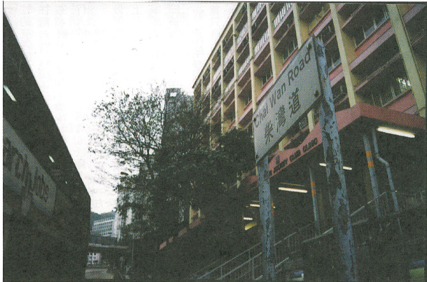
柴灣道「長命斜」空氣污染嚴重令人關注

柴灣道「長命斜」的空氣質素惡劣，所測得的空氣污染水平指數高達一百五十，嚴重危害市民的身體健康。市民認為有關當局對此惡劣的情況，未有積極的改善措施，均望政府多加關注。 【記者李灝濂報導】位於柴灣道，俗稱「長命斜」的一段馬路，大致可分為上下兩段。上段由筲箕灣道至「長命斜」中段消防局一帶；而下段則由中段至柴灣道筲箕灣賽馬會診所。該處受空氣受到嚴重污染，每日所測得的空氣污染水平指數，介乎一百至一百五十之間，空氣污染問題令人擔憂。