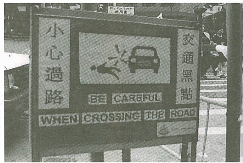
警方特於東區交通黑點設指示牌

【記者江啓康報導】東區有多個繁忙的交通路口為「交通黑點」，過往兩年有近四十宗的交通意外發生。雖未有行人於意外中死亡，但行人的生命安全已受到嚴重威脅！據警務處稱，凡是任何地點在最近的十二個月內，發生九宗或以上有人受傷的交通意外，或發生六宗或以上有行人受傷的交通意外，即被列為「交通黑點」。