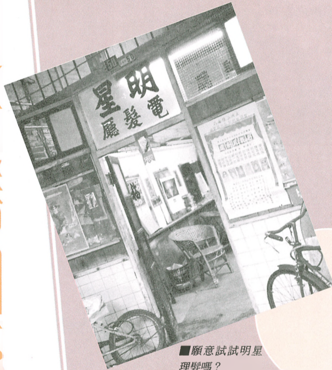
■願意試試明星理髮嗎？

外國遊客來香港要看的，不是高樓大廈、青嶼大幹線，更不是東施效顰的觀光點，而是大澳這地道風情。