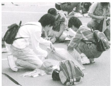
一家大細合力製作和放風箏，樂也融融。

天朗氣清，那兒是好去處？以往，到郊外放風箏或會是一項很好的「節目」。但自從啟德機場搬遷後，放風箏這種有益身心的活動已不再局限在郊外。