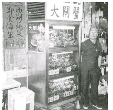
大閘蟹仍秋季的應時美食。