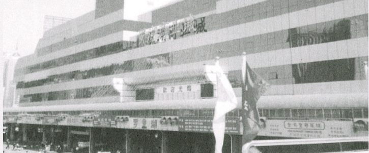
羅湖商業城是港人回港前的最後一個購物好去處。