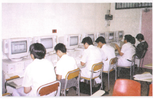
政府應撥資源請電腦室助理，負責電腦維修保養工作，減輕老師的負擔。

中一至中三每星期有一堂電腦科，而中四至中五有五堂，中六、中七的ASL有五堂，而AL則有十堂。而且學生所學的範圍切合現在的市場需要，例如辦公室文書系統，對他們日後工作有實際幫助。學校亦會為同學報考公開考試的電腦科，因此中四至中七的課程安排全部依足教署制定的考試範圍。