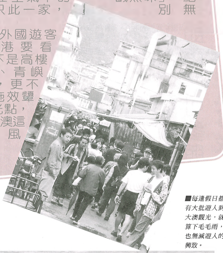
■每逢假日都有大批遊人到太澳觀光，就算下毛毛雨，也無減遊人的興致。