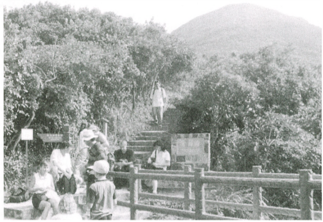
暢遊大自然，往往令人心曠神怡。

紫羅蘭山徑入口於大潭水塘道，黃泥涌水塘公園側，是市區行山路線其中一個選擇。既怕「上山下山」的你，不妨試行紫羅蘭山徑，因它是沿著引水道而建成，大部份是平坦而狹窄的山路、小徑，行山人士毋須「行