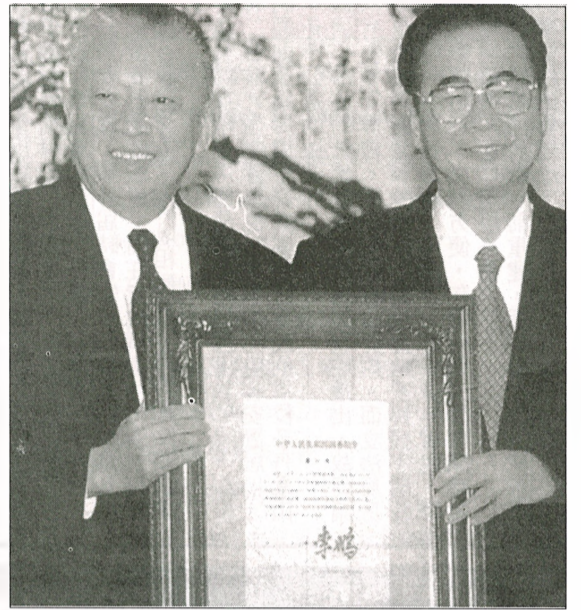
中國國家總理李鵬祝賀董建華當選爲特區行政長官。

【本報訊】二月十一日，董建華在特選選舉中，取得三百二十票，以壓倒性優勢，擊敗兩名對手，正式當選為香港歷史上首位特選行政長官。 對於參選行政長官一事，一直表現得非常高調的董建華，在商人吳光正高姿態宣佈參選，及前首席大法官楊鐵樑有頭威勢加入角逐的刺戟下，董建華更加積極。 特選選舉假香港灣仔會議展覽中心舉行，並由四百名推委投票選出。雖然當日有數十名示威者不停在會展場外抗議，更聲稱這次選舉是「假選舉，真獨裁」，但董建華仍以三百二十票的壓倒性票數勝出，遠遠拋離楊鐵樑和吳光正。 中方表示這次是「公平、公開、公正」的選舉，港英政府及國際社會紛紛發表電文，祝賀董建華當選，並形容為實至名歸。 董的治港理念是確保香港平穩過渡，並著重解決民生問題。 他的目標是要把未來的香港特區建設成爲一個「安定、公平、民主、有愛心、方向明確、目標一致的社會」。 他更承諾對房屋、教育、福利、製造業及工業五大迫切的民生問題，制訂長遠政策及處理所有燃眉之急的問題。 董建華將於九七年七月一日正式就職爲特區行政長官，任期五年。他將帶領港人過渡九七，與港人共同面對未來的挑戰。