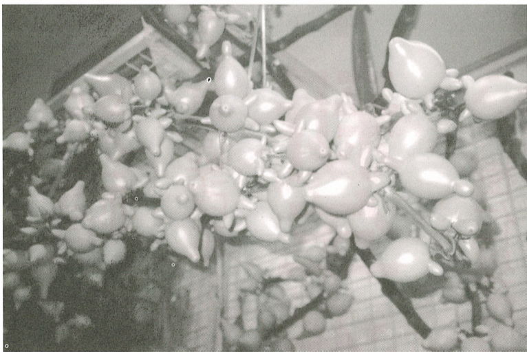
■「五代同堂」好名字，難怪每年都有很多人買回家。