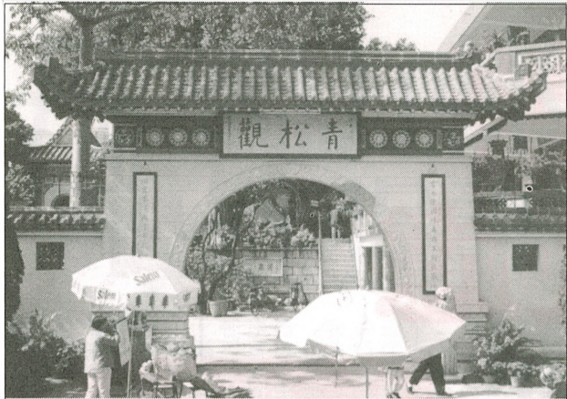
■青松觀古廟，亭台樓閣，值得一遊！

【本報訊】香港人一向對農曆新年十分重視，所以很多市民都會購買年花，取其「花開富貴」、「大展鴻圖」之好意頭，以求「牛」年能事事如意，順利。 以往，一般市民購買年花時，都會在過年前在年宵市場購買現貨，或向新界的花農訂貨。 但近年因為土地租金收入比種植年花可觀得多，香港種植年花的花農越來越少，不少新界農地十居其九均成為了擺放空貨櫃的用地。故現時，在香港找一株合心水的年花也確實不容易。 大陸買年花 慳錢又慳力 一名本港花農向本報表示，現時在大陸訂購年花來港轉售的情況十分普遍，大部份都是從大陸入口的。 該名花農表示，由於香港地價昂貴，導致不少行家也將種植年花轉移到大陸，以減輕成本。亦有些花農索性在大陸花場，以批發價大量購入，再運往香港零售，賺取利潤之餘，更大大節省自己種植年花的經費，確實「除笨有精」。 故此，一些「醒目」的香港人，不惜親自到深圳買年花，一則可免除中間人「貪價」，二來更可親自挑選更合心水的年花。 據了解，在深圳皇崗、蓮花北路及沙灣水庫一帶等地都有種植年花的花場。當地的年花不僅種類繁多，包括有香港人喜愛的四季桔、沙桔、沙柑、芍藥花、菊花及桃花等，而且售價比香港便宜六至七成。