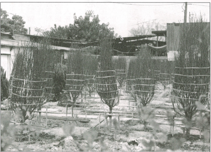
■年花種植場將變貨櫃場。

【本報訊】新年新希望，不少人總會祈福以求來年事事順境。你知不知道新年祈福熱門地在哪裡？沒錯啦！就是位於屯門，有一「眾廟之門」稱號的——青松觀。 道教寺廟 古色古香 青松觀是一所道教寺廟，廟內主要供奉八仙之一的呂洞賓。在祭台上，有一尊獅子玉，據說是清朝流傳至今。 在農曆年間，你還可以帶著「祝福」回家。每年新年，大殿內都會放著一棵大桃花，上面掛滿了一盞盞粉紅色的花燈。 每盞燈都寫著恭賀的字句——「恭喜發財」、「龍馬精神」……等。善信只要添數十元香油，便可以將燈帶走。 新春期間，經常吃一些油膩的食品，青松觀內，三百六十五天也有齋宴供應，到這兒求神作福之餘，品嚐一下清淡的齋菜，也是不錯的選擇。 求神作福 品嚐齋宴 到青松觀，當然是求一支好籤，以希望一家平安，萬事如意。在大殿內，有數個解籤的攤檔，善信求籤後，可找他們指點一下迷津。在拜神之餘，觀內亦有很多值得遊覽之處。 殿旁，有一壁群仙賀壽圖，壁前放滿了年花，燦爛奪目，與壁上的神仙，互相輝映。除了大殿的雄偉修飾外，觀內還有一個古色古香的花園。亭台樓閣、小橋流水，很樸實古雅。 青松觀座落於屯門建生路旁，在旺角火車站乘搭五十八X，或在葵芳地鐵站，乘坐五十八M，在建生下車，橫過天橋便可以見青松觀了。