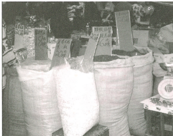
■瓜子是新年不可或缺的小食。