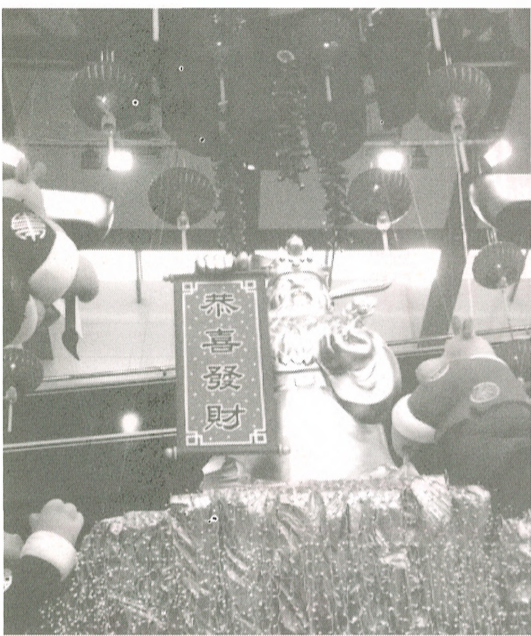
■聖誕燈飾甫一謝幕，商場即以賀歲裝飾示人。

除舊迎新 新春伊始 揮春紅封 營造歡樂祥和氣氛 年花糖果「發財好市」 早在市面各處鋪陳 金銀元寶 既是大朋友的夢中情人 也是小朋友饞咀目標 就在迎接牛年時 看看我們如何歡送鼠年