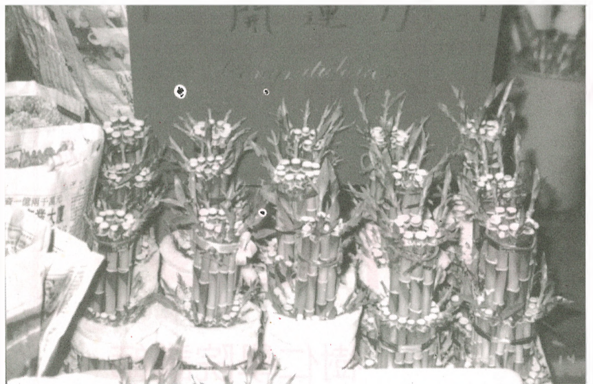
■年花新貴開運竹，雖然價錢不便宜，但意頭十足，極受市民歡迎。