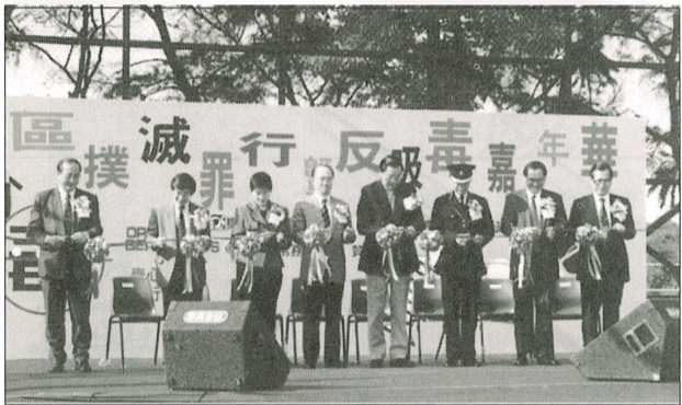
維園舉行「東區撲滅罪行暨反吸毒嘉年華」。

【本報訊】一月五日維多利亞公園舉行了一個名為「東區撲滅罪行暨反吸毒嘉年華」，目的是要提高市民對撲滅罪行及反吸毒的認識。 根據藥物濫用資料中央檔案室的資料顯示，新呈報的吸毒人數：二十一歲以上的吸毒人數下降了百分之零點八，二十一歲以下的吸毒人數下降了百分之零點四。 東區於九六年一月至六月有吸毒紀錄的人數較九五年同期有上升的趨勢，二十一歲以上的吸毒人數上升了百分之零點七，而二十一歲以下的吸毒人數則上升了百分之零點一。 有見及此，由禁毒常務委員會贊助東區撲滅罪行委員會、東區政務處、東區警區以及東區區議會攜手合辦是次活動。