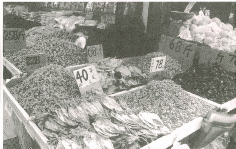
■參茸海味是新年的「高檔」食品。