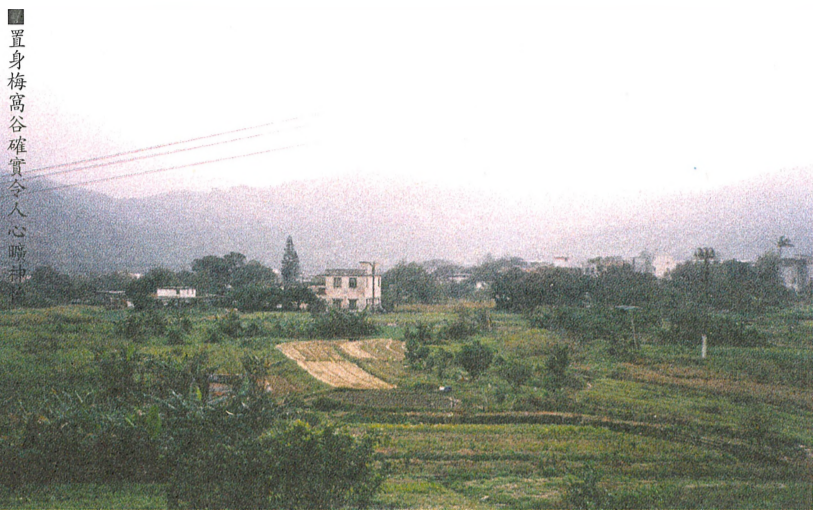
置身梅窩山谷確實令人心曠神怡。

到大嶼山遊到玩，總是在到達梅窩頭後，便轉車到寶蓮寺拍照，或到大澳嚟啖蝦膏味。遊人往往忽略了極具鄉村氣息的梅窩。事實上，對於一心想逃離都市煩囂的你，踏著單車遊玩風景秀麗的梅窩，這是一個很好的選擇。 由中環港外線碼頭，乘一句鐘到達梅窩後，向碼頭右方步行約十分鐘後，拍拖和「謀殺菲林」聖地的銀礦灣便在前。 在海灣旁邊有很多出租單車檔口，平均收費一小時十元。如租借一整天，也只不過三十元，非常便宜。在租得單車後，你便可開始環繞梅窩白銀村一週的旅程。