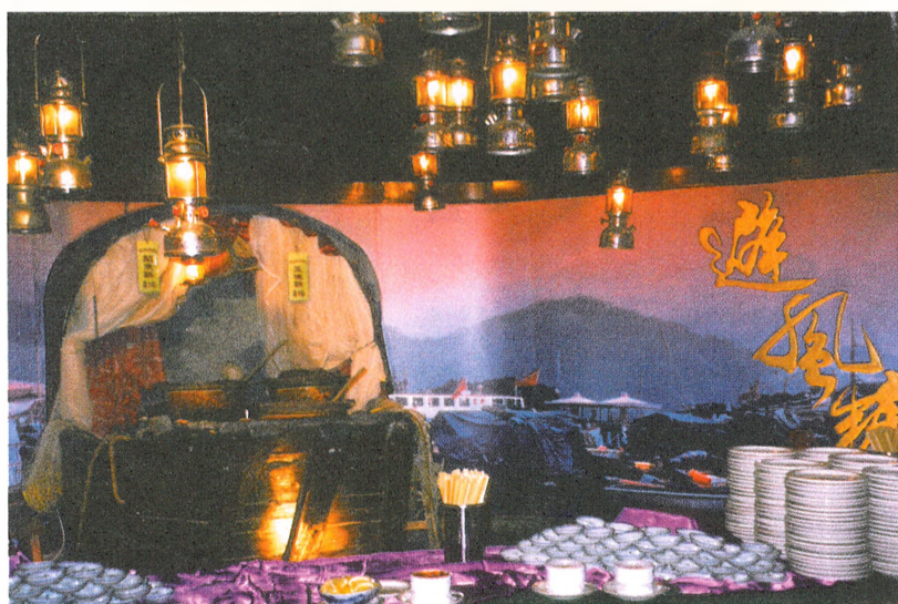
這半隻從海灘拾回來的木艇，更令伐如回到昔日的避風塘，亦令或這裡的佈置更添真實感。

「香港拼圖」除了有懷舊食肆之外，就連懷舊店舖都俱在，「美而廉」是一間舊式餅店之名，內裡有售舊式乾餅。稍後還會有巷仔理髮、雀鳥占卜、花布街等，真是包羅萬有。 「香港拼圖」，將昔日香港的生活點滴拼砌一起。在這裡，顧客不但能填飽肚子，亦能重溫香港舊日的日子。