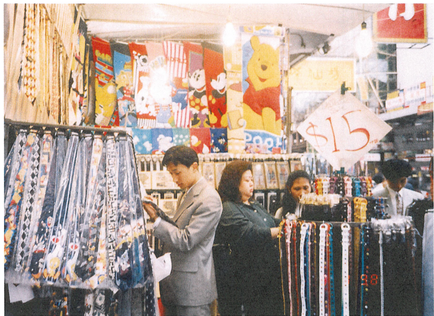
■旅遊業不景商舖紛紛以大減價招徠顧客。

據一項調查發現，在亞洲金融風暴後，香港連續六年擁有的全球物價最便宜的旅遊城市地位，已被台北取代，只能緊隨曼谷排列第三—香港「購物天堂」的美譽已不再。