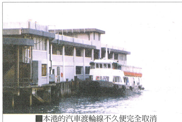
本港的汽車渡輪線不久便完全取消