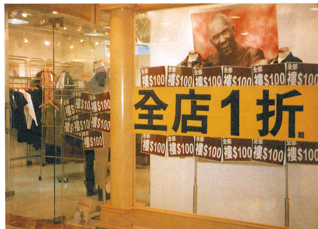
■零售事業生意額大跌。

遊覽勝地，相信能令不少旅客留下深刻印象。志蓮靜苑的建成，又會發展一個新的旅遊點，相信多一點大型建設，一定會吸引更多旅客。